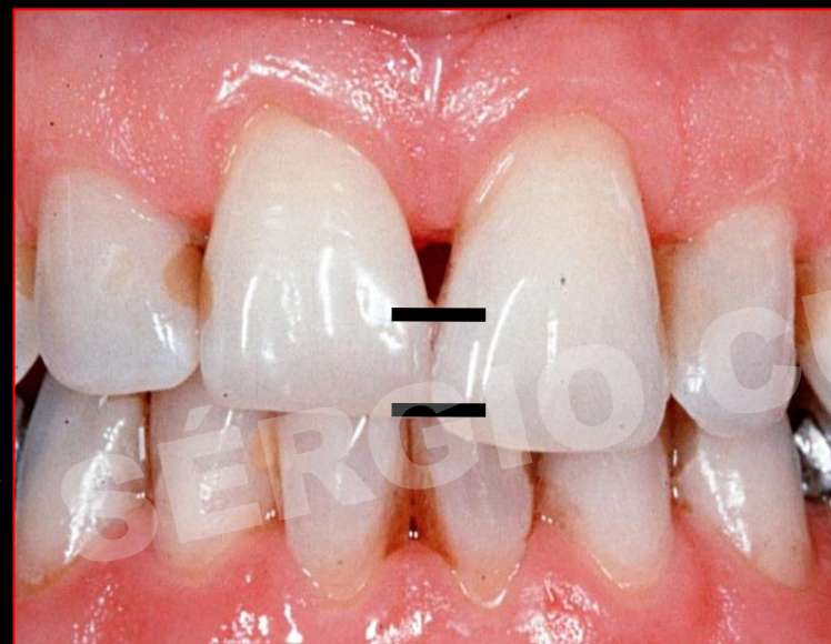
DENTE MAIS “TRIANGULAR”