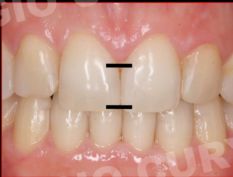
DENTE MAIS “QUADRADO”

COROA TRIANGULAR: PONTO DE CONTATO É PEQUENO E POSICIONADO PARA INCISAL